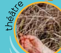
Figure de proue de la scène rock alternative française depuis les années 90, Pigalle investit les bacs à sable pour la deuxième fois. Avec Pouët , il brosse une mise en scène de la vie moderne à hauteur de gosse, désopilante, loufoque et terriblement réaliste. Côté musique, c'est une déferlante de sonorités : du rock, du tango argentin, du reggae et une multitude d'instruments ! Dans son monde, la chanson enfantine ne minaude pas, elle est alternative et carrément décalée.

Dimanche 12 février 2017 • 16h • 5 € +1€ de droit de location